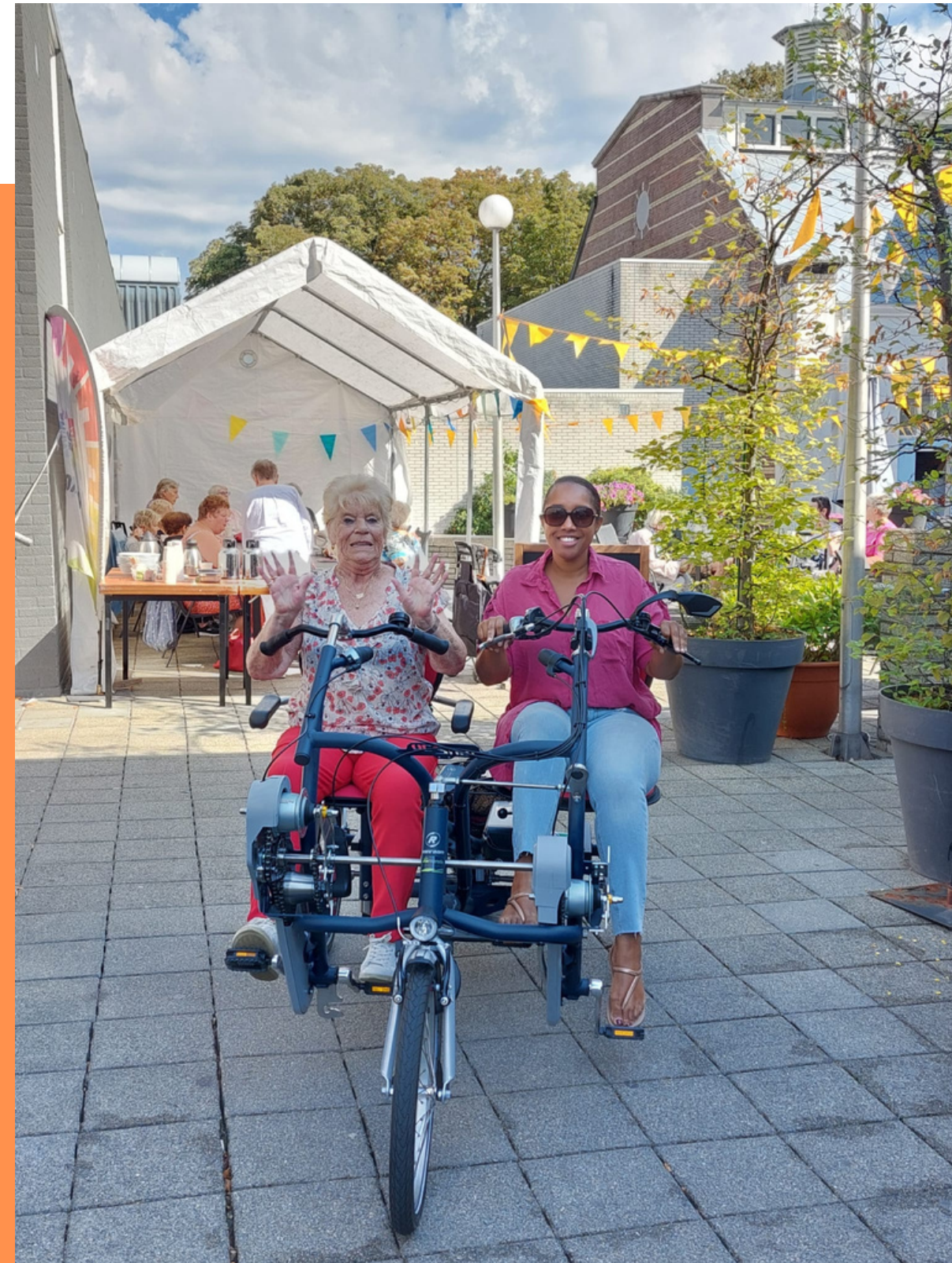
Duo-fiets een donatie van Seniorenraad Kralingen-Crooswijk

A Thousand Words Cultuur Concreet DOCK Erasmusstichting Gemeente Rotterdam – bewonersinitiatief Laurensfonds Neyenburg Oranje Fonds PLUS supermarkt RCOAK