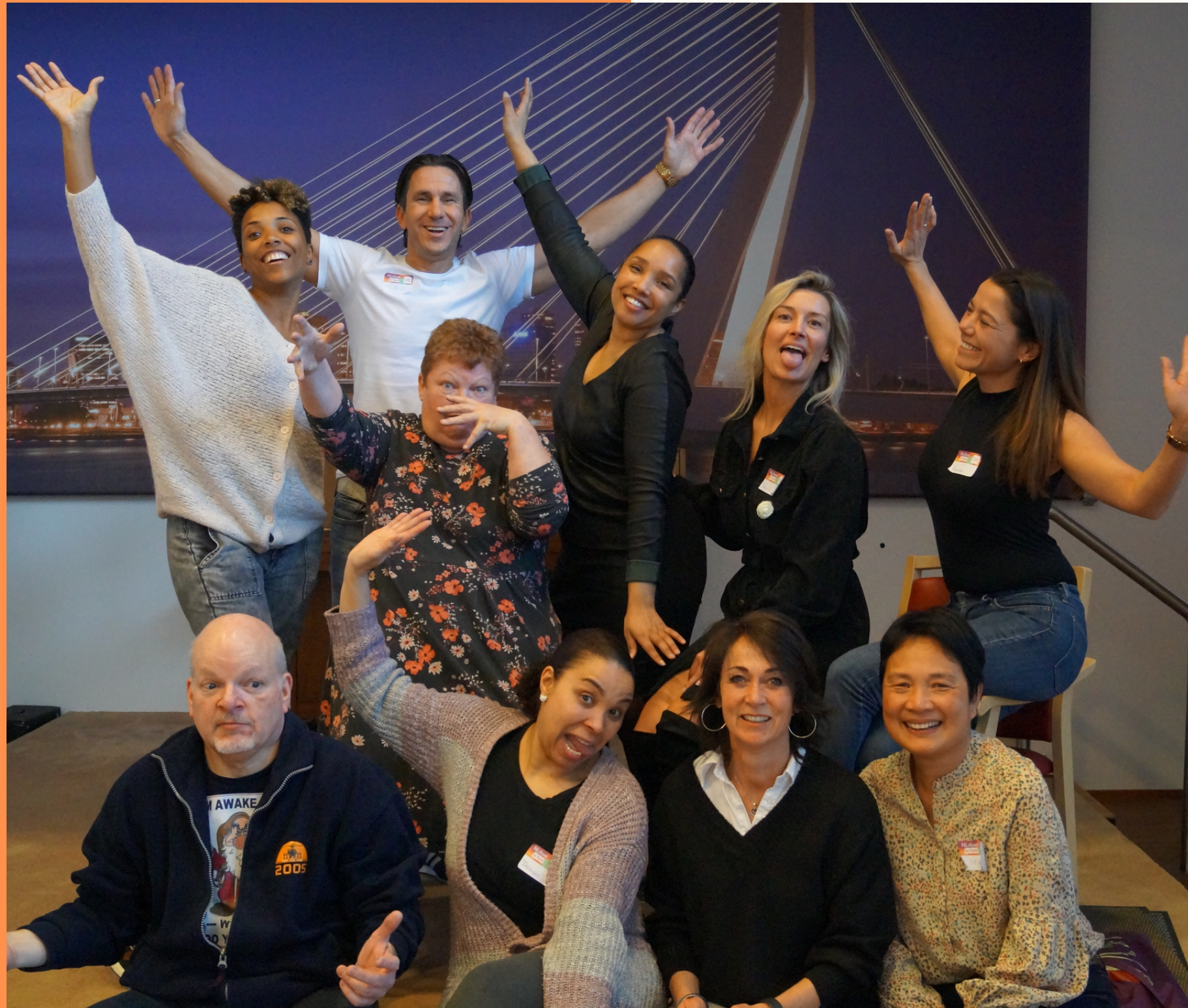
Groepsfoto na afloop van NLdoet